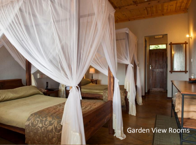
Garden View Rooms