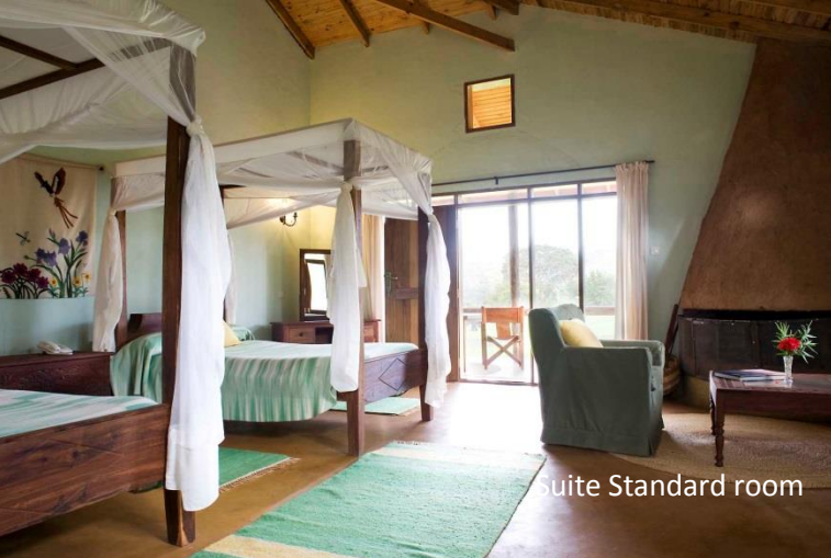
Suite Standard room